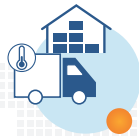
临床药品 仓储和全球冷链运输