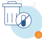
临床药品 返回及销毁