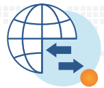
进出口 和批件申请